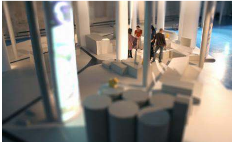
Building Blocks t.v., Stockholm at Large överst t.h. samt Om Lövholmen - den nya svenska modellen längst ned t.h.