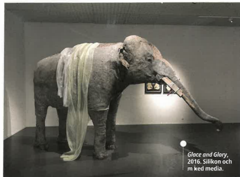
Glace and Glory, 2016. Silikon och m ked media.