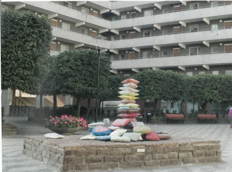
Schlaraffenland, 2001, Offentlig skulptur av målad brons, Johan Enbergs torg i Solna. Kuddarna är från hans mamma, som hade en handarbetsaffär. De är gjutna efter äkta förlagor.